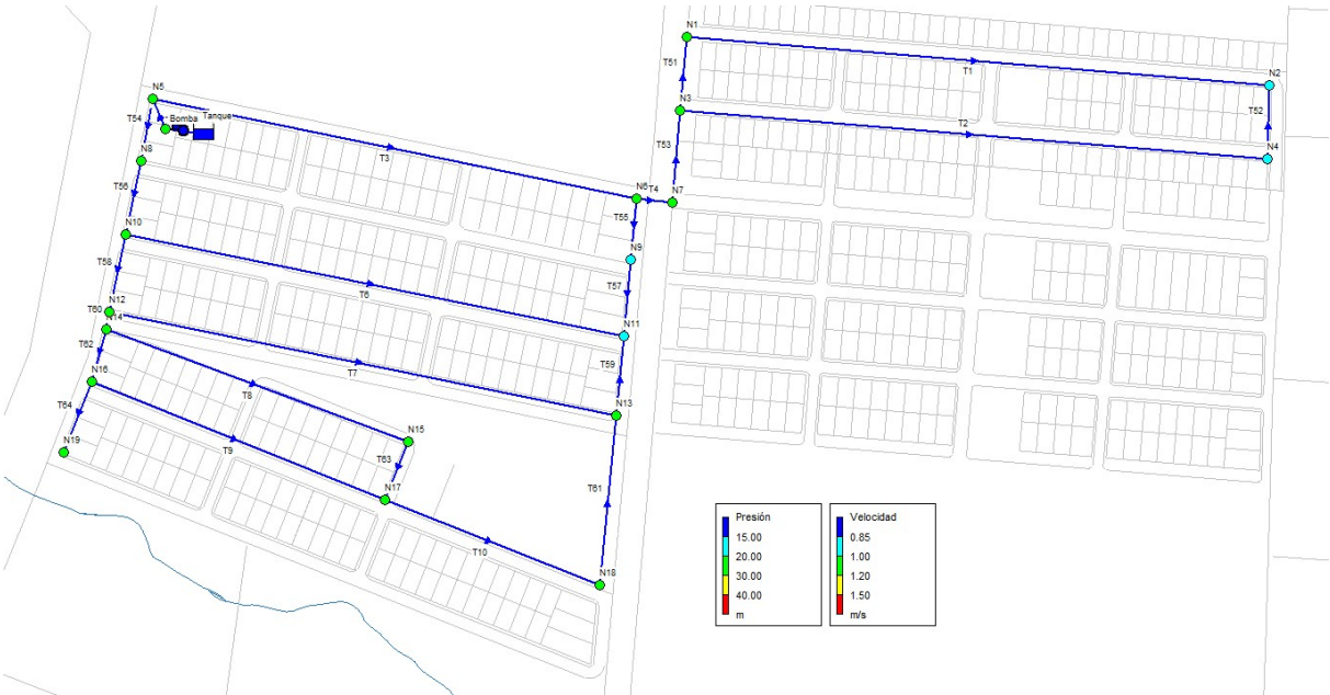
Figura 3.1 Disposición de redes. Estado para caudal máximo horario de Primera Etapa.