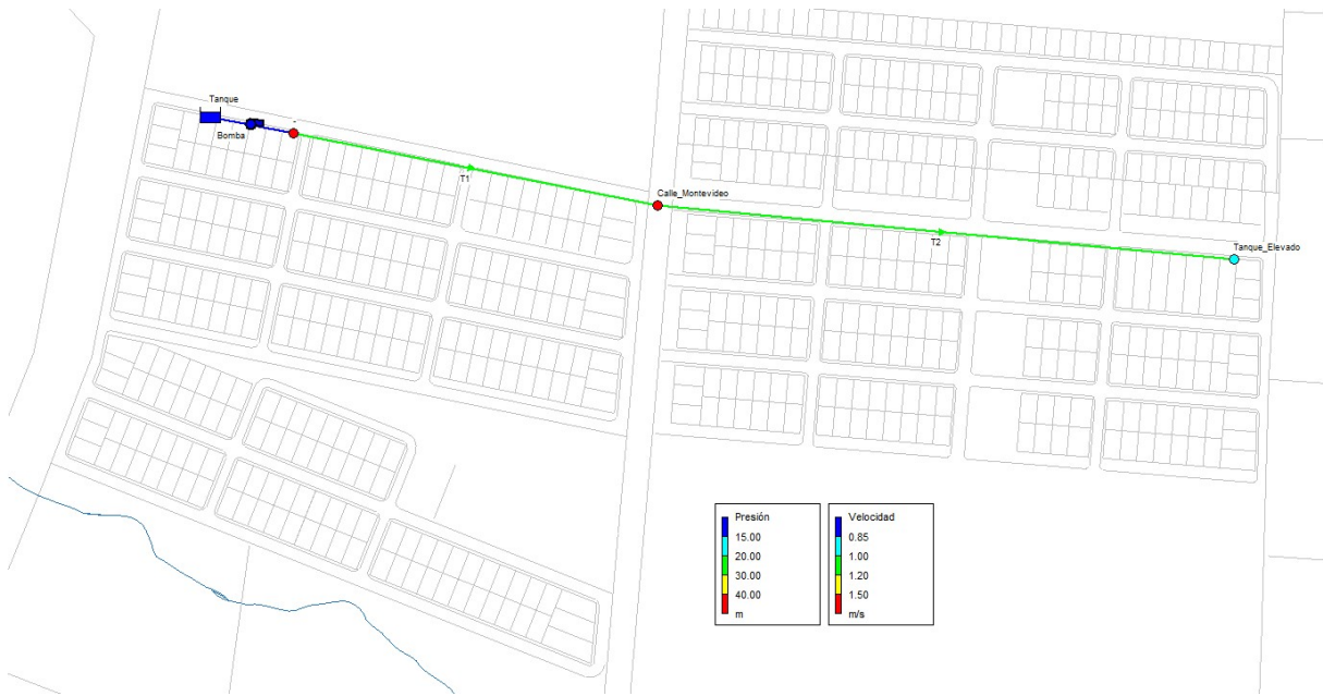
Figura 3.3 Red de abastecimiento de tanque elevado. Estado para caudal máximo diario de Tercera Etapa.